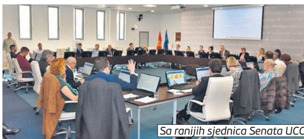
Sa ranijih sjednica Senata UCG

viće tri mjeseca u kasarni "Milovan Šaranović" u Danilovgradu, gdje će učiti osnovne vojničke vještine kao i procedure u slučaju vanrednih okolnosti i pomoći stanovništvu. Nakon završene obuke, kako kažu iz Ministarstva odbrane, postoji mogućnost zaposlenja u Vojsci Crne Gore.